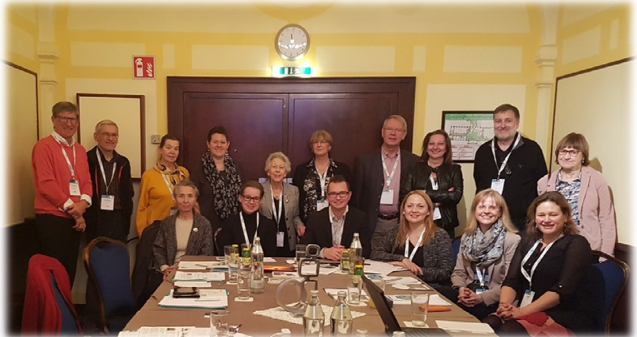
Pictured from left to right ~ back row: